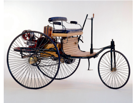
Mercedes-Benz 125 år

Alla tre 50-årsfirarna plus mängder av andra historiska fordon kan beskådas på Elmia i Jönköping i påsk. Alla som är intresserade av äldre fordon och vill värna om bevarandet av dessa som en ovärderlig del av vårt gemensamma kulturarv har anledning att göra ett besök.