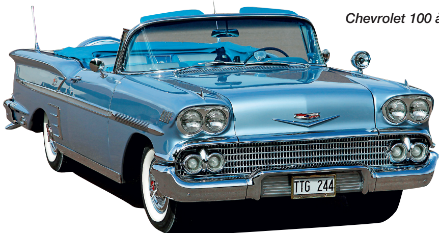
Chevrolet 100 år

Årets Bilsport Performance & Custom Motor Show är verkligen en jubileumsutställning!