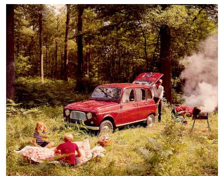
Renault 4L 50 år

BILSPORT PERFORMANCE & CUSTOM MOTOR SHOW Elmia, Jönköping Påskhelgen 22 - 25 april 2011